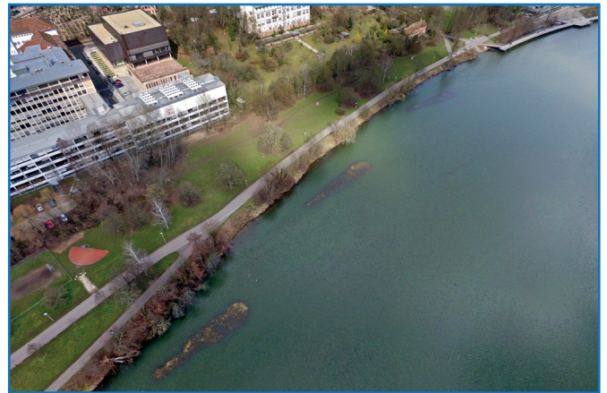
Im Unteren Wöhrder See werden drei Ökoinseln angelegt.